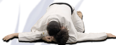
«LE CHEVAL» Tate-shiho-gatame