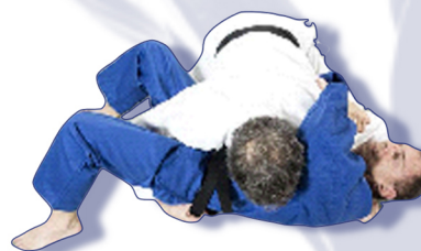
«LA CROIX» Yoko-shiho-gatame