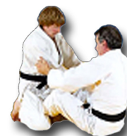
Renversement Les pieds à l'intérieur