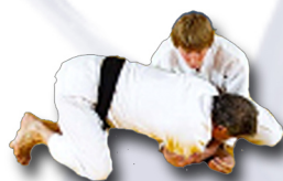
Retournement sur le côté Coudes à deux mains